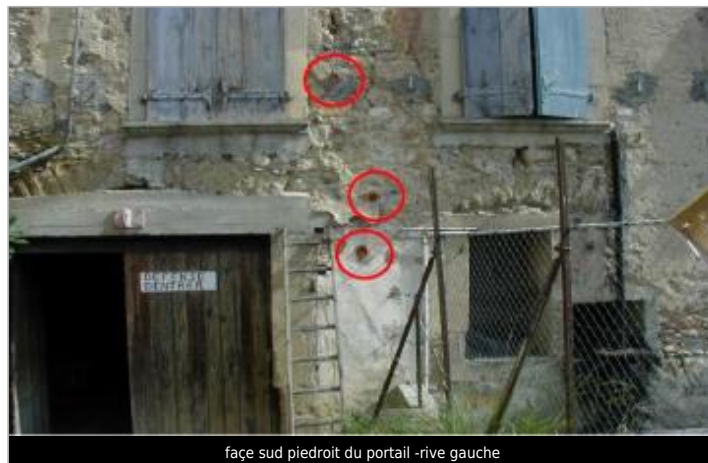
façade sud piedroit du portail -rive gauche

GÉOLOCALISATION Coordonnées WGS84 : X: 2.21402210 / Y: 43.05951700 Coordonnées RGF93 (Lambert 93) X: 635920.27 / Y: 6218120.27 Coordonnées RGF93 (ETRS89) : X: 2.2140221 / Y: 43.059517 Code Hydro: Y1--0200 Rive de référence: Gauche