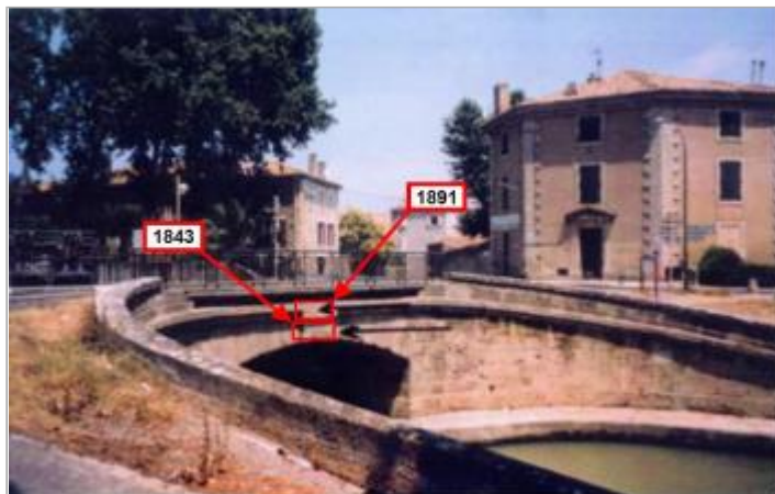
pont écluse sur le canal de jonction