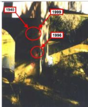
Culée, pile - rive droite Aval