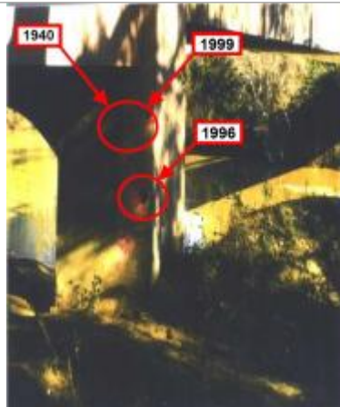
Culée, pile - rive droite Aval