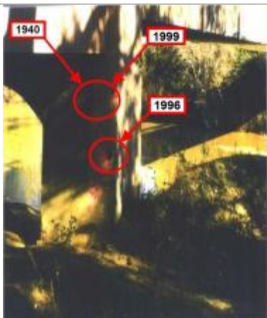
culée, pile - rive droite - aval