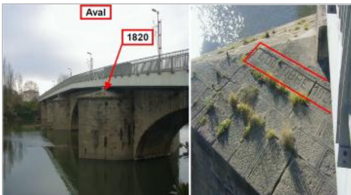
première pile gauche - Aval