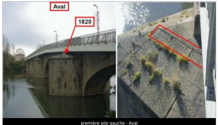
première pile gauche - Aval