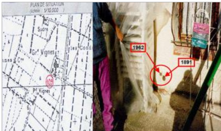
parcelle N° HP 198

Coordonnées WGS84 : X: 3.04705750 / Y: 43.20065400