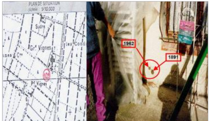
parcelle N° HP 198

Coordonnées WGS84 : X: 3.04705750 / Y: 43.20065400