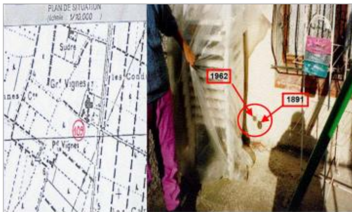
angle des murs de la maison - rive droite