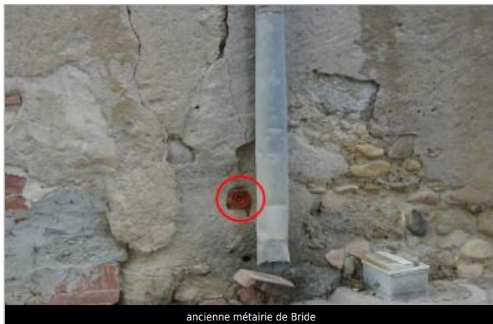
ancienne métairie de Bride