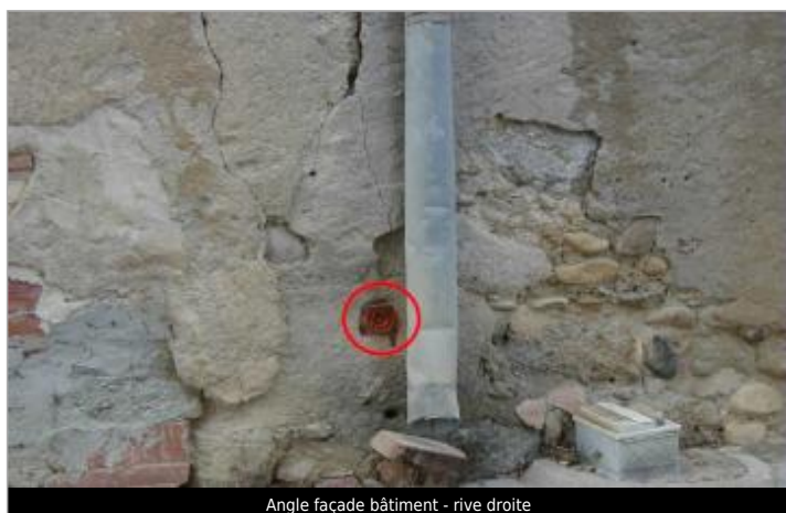
Angle façade bâtiment - rive droite