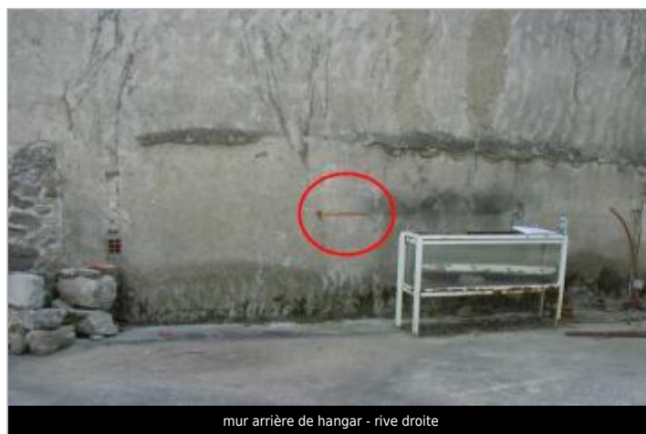
mur arrière de hangar - rive droite

GÉOLOCALISATION Coordonnées WGS84 : X: 2.31487550 / Y: 43.10385700 Coordonnées RGF93 (Lambert 93) X: 644185.27 / Y: 6222973.4 Coordonnées RGF93 (ETRS89) : X: 2.3148755 / Y: 43.103857 Code Hydro: Y1220500 Rive de référence: Droite