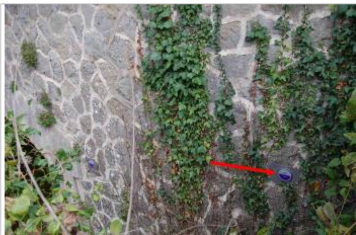
repère octobre 1891

Code : DDTM11_R_181_2 Date de mise à jour : 20/03/2019 Auteur : DDTM 11