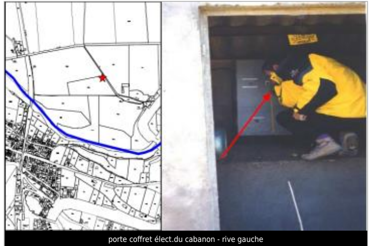
porte coffret élect. du cabanon - rive gauche

Coordonnées WGS84 : X: 2.66273390 / Y: 43.25328900