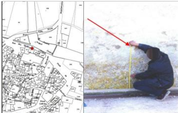
mur du bâtiment - rive droite