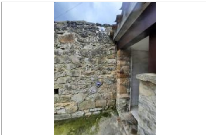
site au niveau du pont Vieux