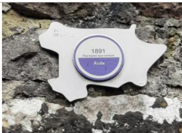
repere de 1891

Altitude calculée de l'eau (en m) : 203.3