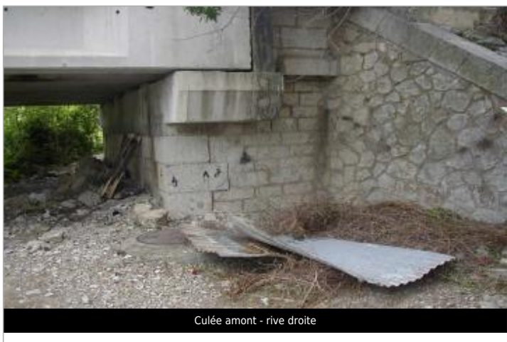
Culée amont - rive droite