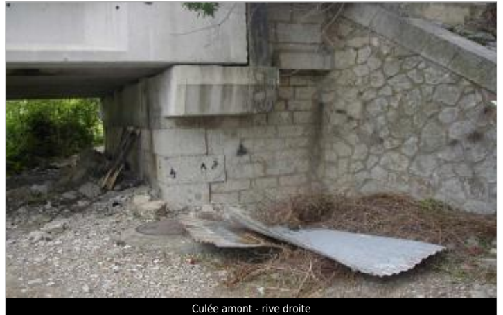
Culée amont - rive droite

Coordonnées WGS84 : X: 2.71868490 / Y: 42.85998500