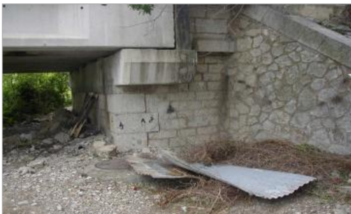
Culée amont - rive droite - repère disparu