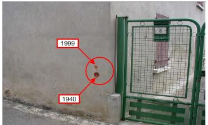
mur d'enceinte - rive gauche

Coordonnées WGS84 : X: 2.30851400 / Y: 43.09452600