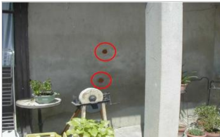
façade intérieure - rive gauche