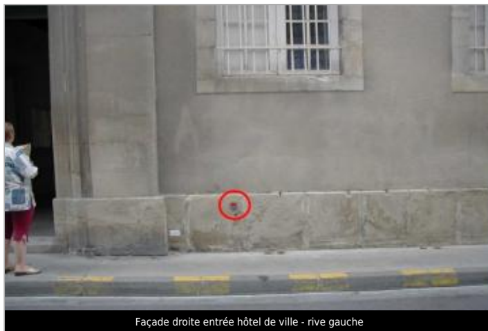
Façade droite entrée hôtel de ville - rive gauche