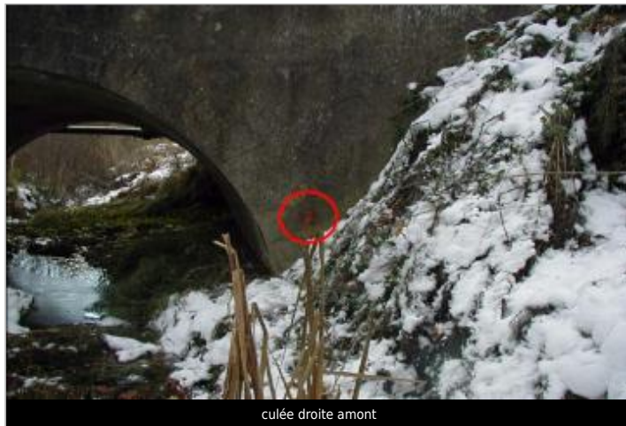
culée droite amont