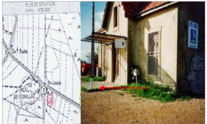
seuil d'entrée du bâti.-rive gauche du canal

Coordonnées WGS84 : X: 3.04685200 / Y: 43.11243300