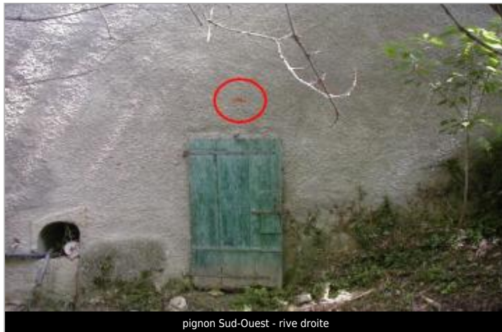
pignon Sud-Ouest - rive droite

Coordonnées WGS84 : X: 2.32475090 / Y: 43.12831800