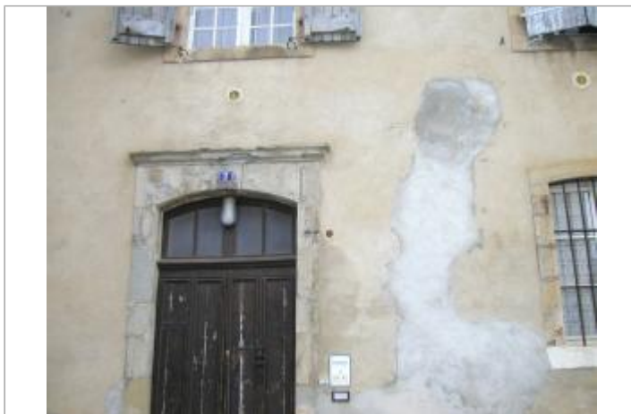
Piedroit entrée rive gauche