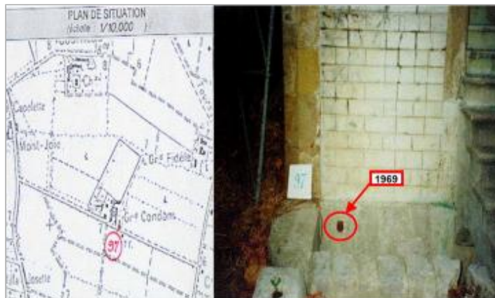
angle droit de porte de chapelle.- rive droite