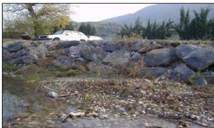
murette, grosses pierres - rive gauche

GÉOLOCALISATION Coordonnées WGS84 : X: 2.21000990 / Y: 42.86953900 Coordonnées RGF93 (Lambert 93) X: 635381.83 / Y: 6196999.9 Coordonnées RGF93 (ETRS89) : X: 2.2100099 / Y: 42.869539 Code Hydro: Y1110540 Rive de référence: Gauche