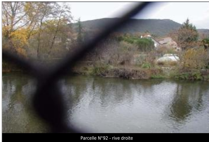
Parcelle N°92 - rive droite