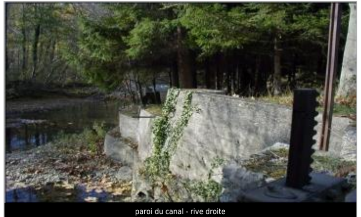
paroi du canal - rive droite