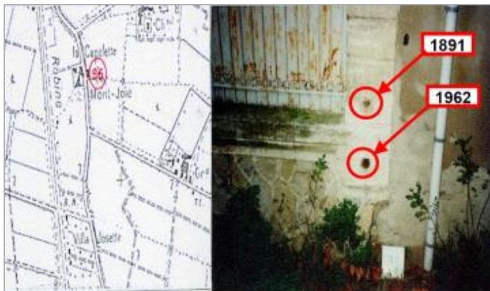
pilier d'angle du mur de limite - rive droite

Coordonnées WGS84 : X: 3.01107020 / Y: 43.21879000