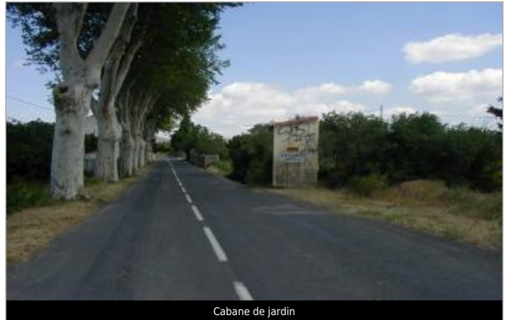
Cabane de jardin

Coordonnées WGS84 : X: 2.71894250 / Y: 42.86130000