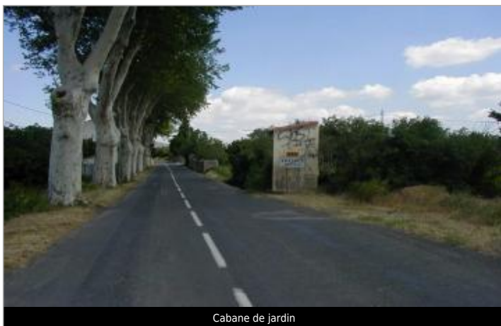
Cabane de jardin