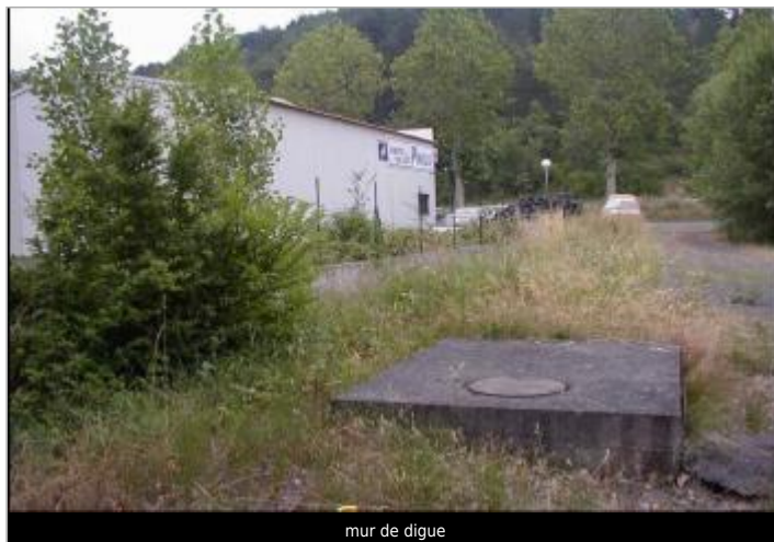
mur de digue