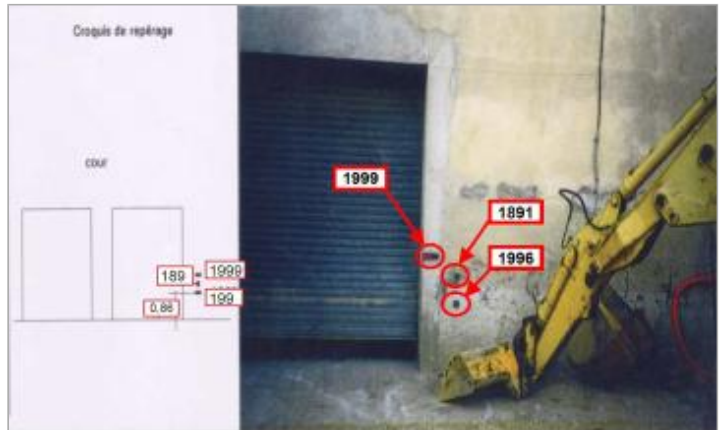
piédroit du portail de la cour - rive droite