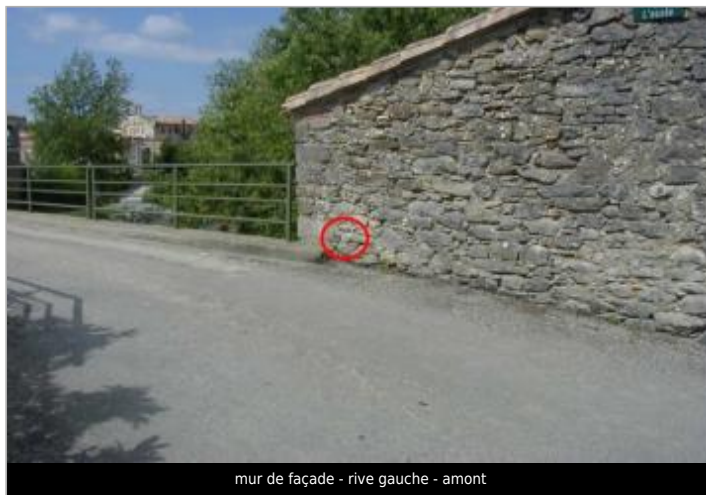
mur de façade - rive gauche - amont