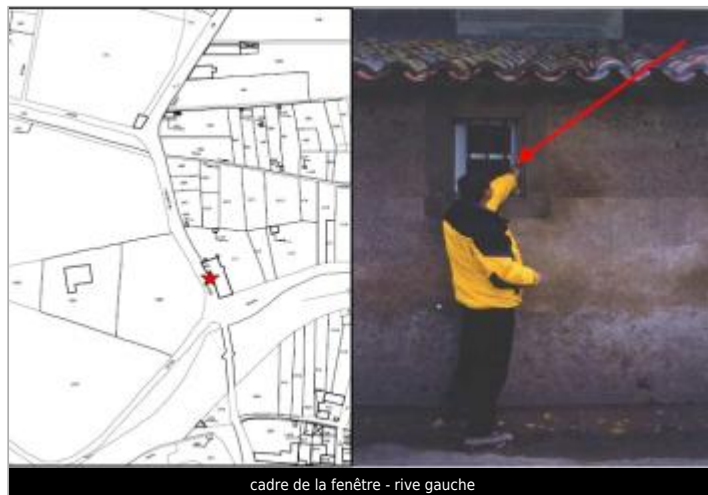
cadre de la fenêtre - rive gauche

Coordonnées WGS84 : X: 2.58602110 / Y: 43.28516200