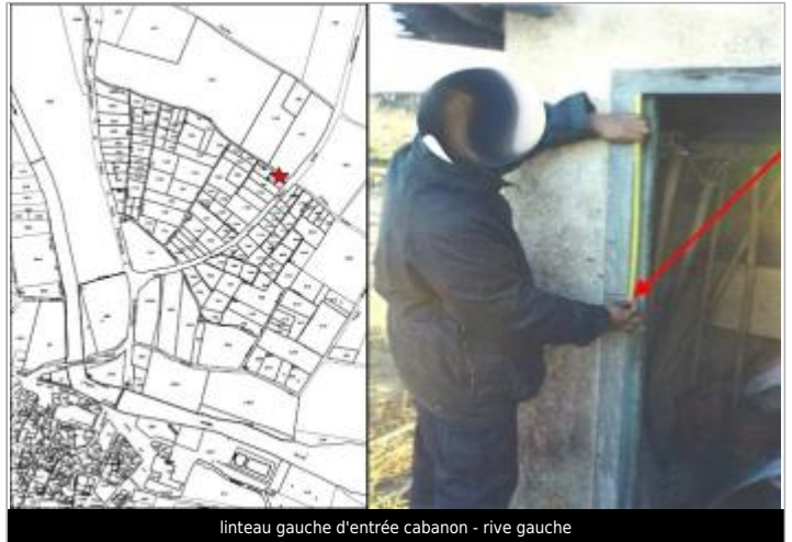
linteau gauche d'entrée cabanon - rive gauche

Coordonnées WGS84 : X: 2.57084830 / Y: 43.29439800