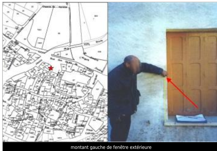
montant gauche de fenêtre extérieure