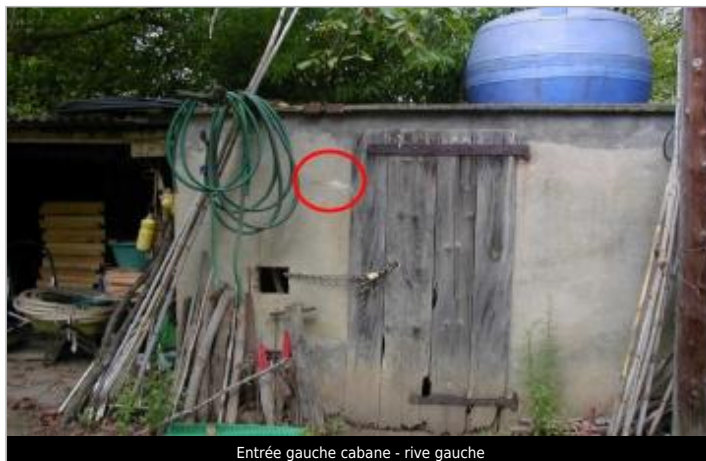
Entrée gauche cabane - rive gauche