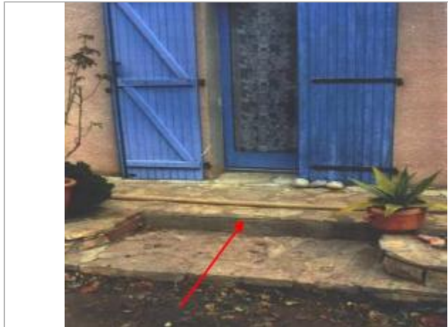
seuil d'accès au logement - rive droite

Coordonnées WGS84 : X: 2.77355550 / Y: 42.97912600