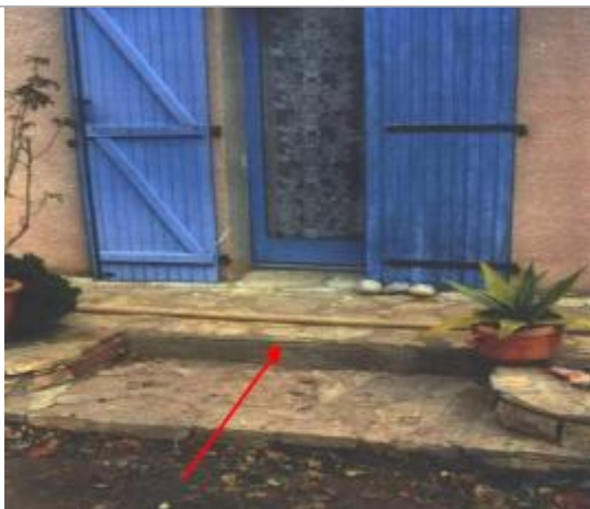
seuil d'accès au logement - rive droite

Altitude calculée de l'eau (en m) : 130.6