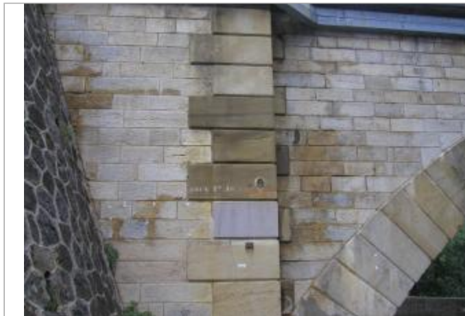
culée gauche amont