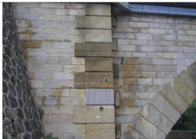
culée gauche amont