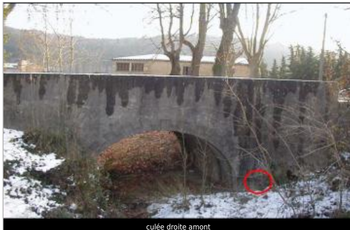
culée droite amont

Coordonnées WGS84 : X: 2.17424190 / Y: 42.94279100