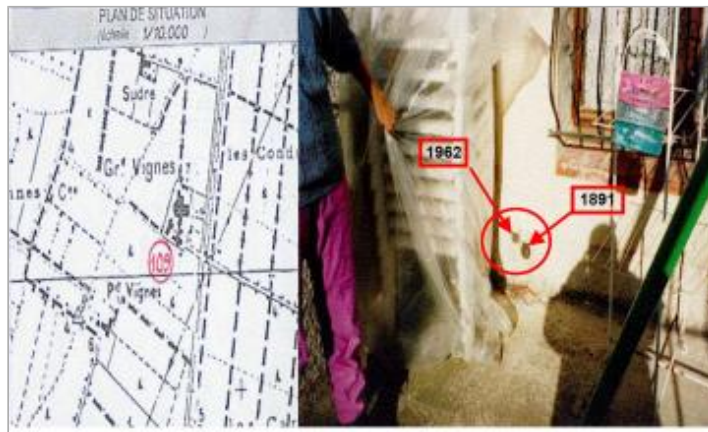
parcelle N° HP 198