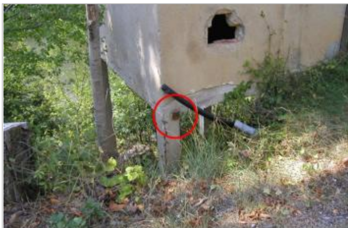
Façade rive droite ancienne station de pompage