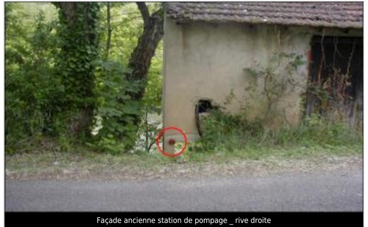
Façade ancienne station de pompage _ rive droite