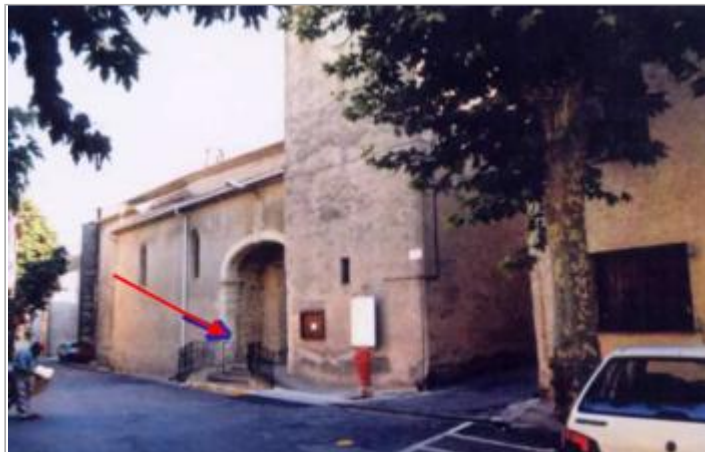
Portail d'entrée rive gauche