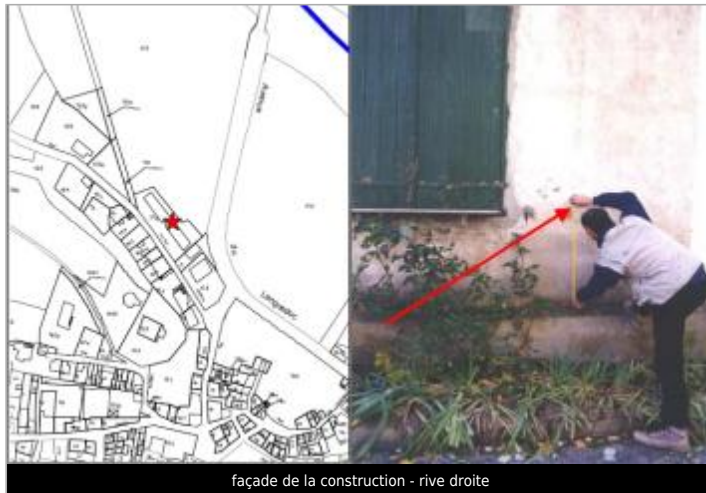
façade de la construction - rive droite