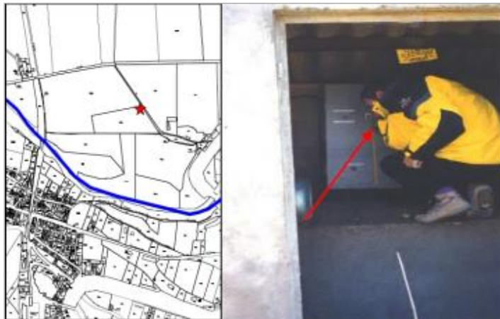
porte coffret élect. du cabanon - rive gauche