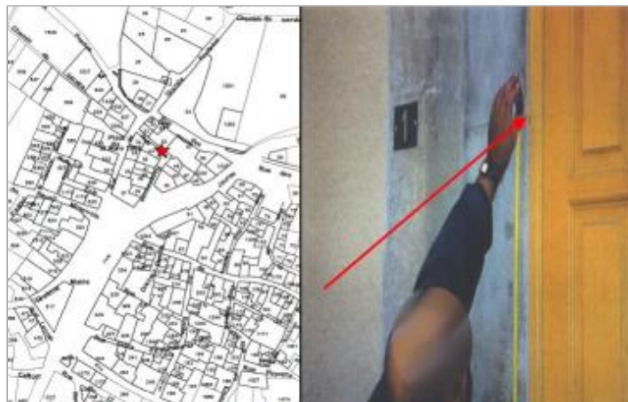
pilier gauche de l'entrée - rive droite

Coordonnées WGS84 : X: 2.56677250 / Y: 43.29231300