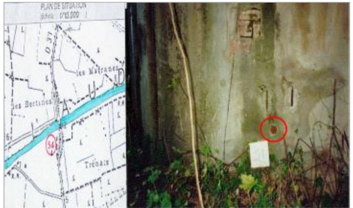
sous le pont - culée droite

Coordonnées WGS84 : X: 3.11107890 / Y: 43.24723600