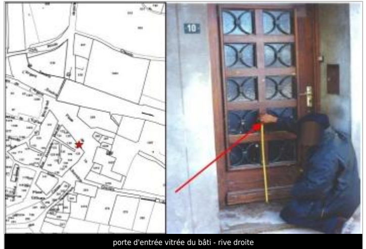
porte d'entrée vitrée du bâti - rive droite