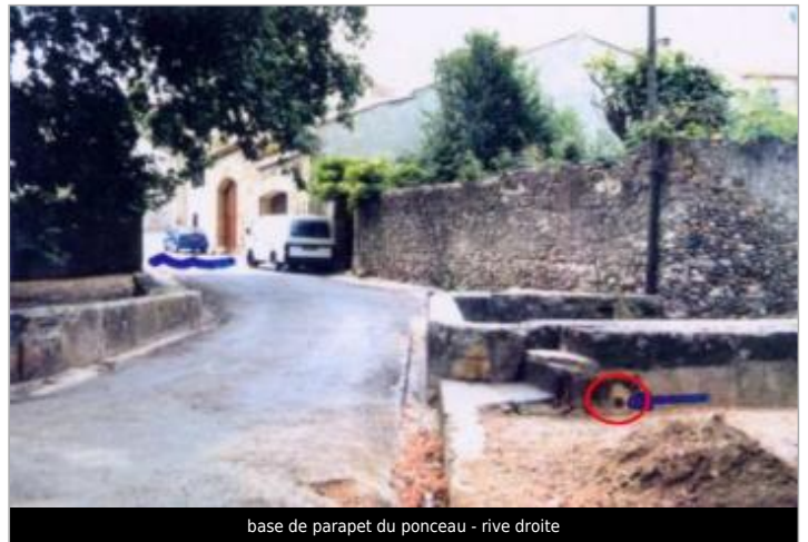
base de parapet du ponceau - rive droite