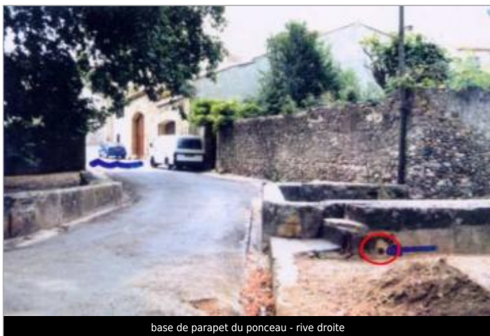
base de parapet du ponceau - rive droite