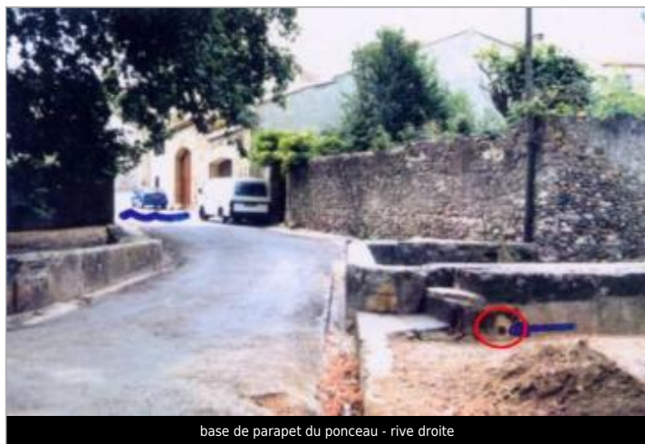
base de parapet du ponceau - rive droite