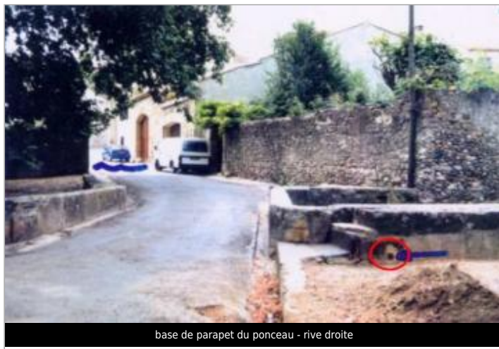
base de parapet du ponceau - rive droite