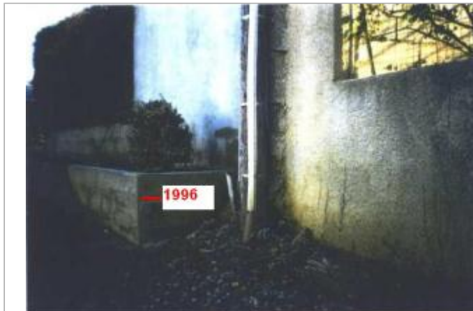
mur d'enceinte - rive gauche