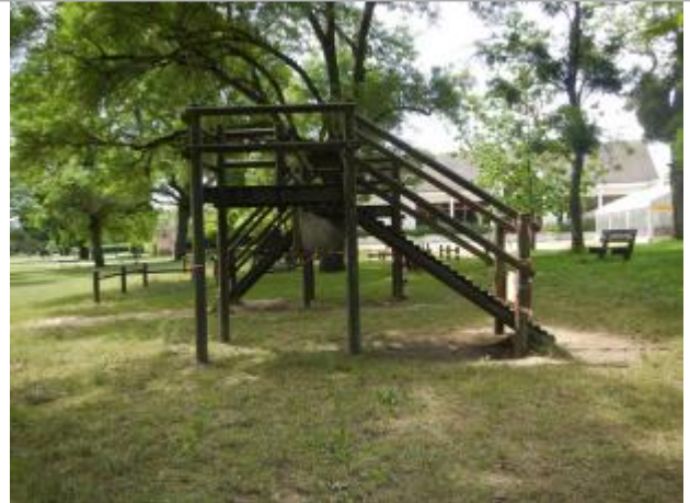
Site en juin 2017