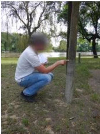
Repère de la crue de juin 2016

Altitude calculée de l'eau (en m) : 89.176 m