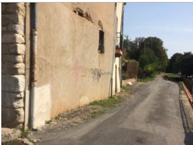
Vue de la facade

Différence entre le niveau d'eau et la référence (en m) : 1.140 m