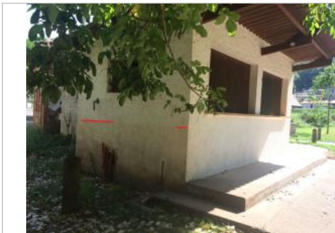
Le trait rouge marque le niveau atteint par la crue du 28/11/2014