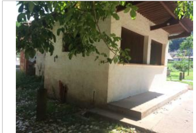
Vue du cabanon